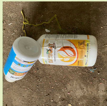
Botol Obat Satu Titik