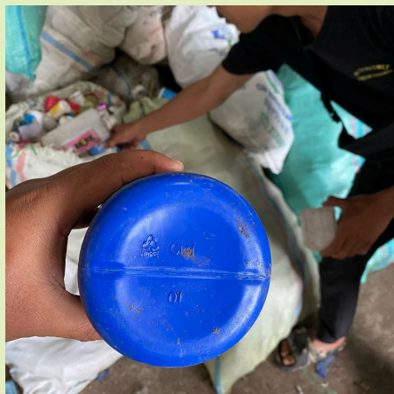
Botol Obat Setengah Garis