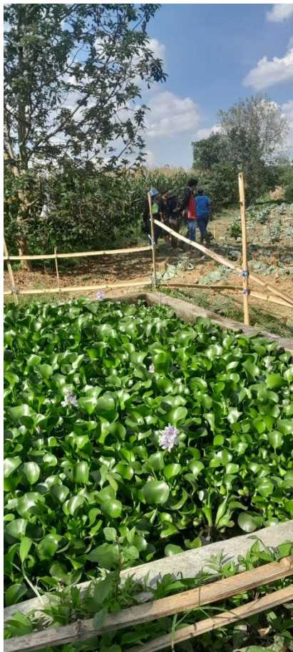
Dok : Desa Barung Kersap

Limbah adalah produk buangan yang sudah tidak memiliki nilai atau manfaat. Limbah dapat berupa sampah, air kakus dan air buangan dari berbagai aktivitas domestic lainnya. Limbah padat lebih dikenal sebagai SAMPAH. Limbah padat maupun cair seringkali menimbulkan permasalahan yang kompleks terhadap lingkungan. Untuk mengurangi dampak negative berupa pencemaran dari limbah padat maupun cair yaitu melakukan pengolahan limbah tersebut menjadi bahan pupuk organik.