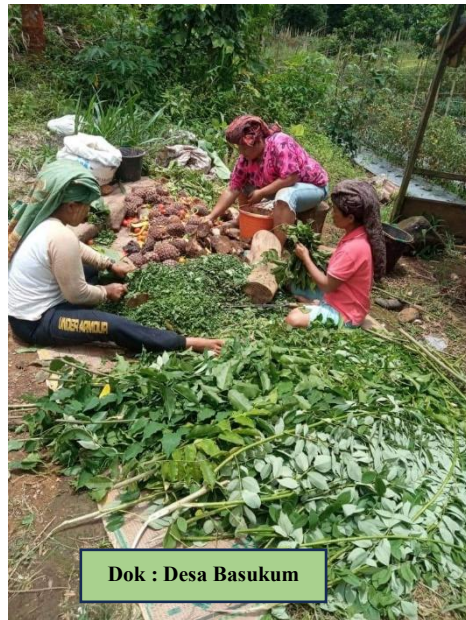
Dok : Desa Basukum

Cincang/chopper bahan yang digunakan \pm 2 cm. Campurkan molasis, bakteri pengurai, dedak dan air sesuai kebutuhan \pm 100 liter. Aduk merata bahan dan siram merata, basah tetapi tidak mengeluarkan air ketika diperas. Kemudian di fermentasi selama 1 bulan dan siap untuk digunakan.