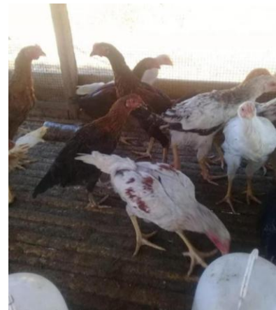
Gambar 1.4. Ayam buras