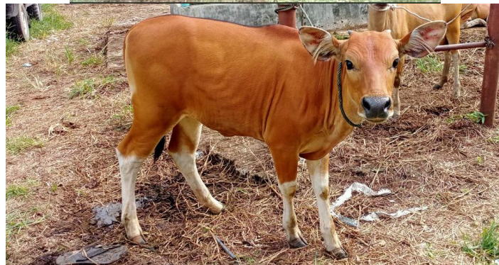
Gambar 1.3 Sapi Lokal