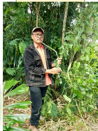
Dok : Desa Barung Kersap