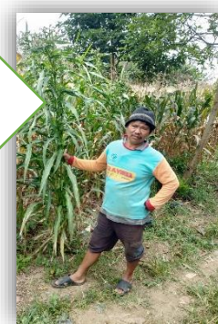
Dok : Desa Barung Kersap