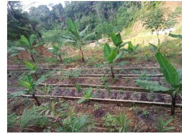
Dok : Desa Buluh Awar