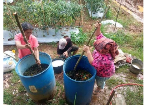
Dok : Basukum