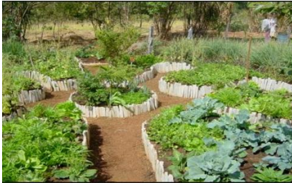
Dok : Google

Pembuatan bedengan membantu mencegah genangan air yang dapat merusak tanaman dan tanah, menghindari akumulasi air yang berlebihan di lahan, memaksimalkan pengaplikasian pupuk organik sehingga menciptakan kondisi yang optimal bagi pertumbuhan dan produktivitas tanaman. Model bedeng dapat disesuaikan dengan kondisi lahan serta peruntukannya. Untuk penahan bedengan dapat dipergunakan bahan-bahan yang banyak ditemukan disekitar lingkungan pertanian seperti : sabut kelapa, bambu, pelepah sawit, batu, pecahan genteng dan sebagainya