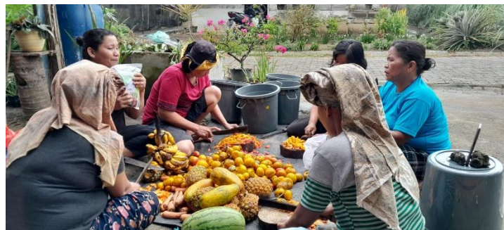
Dok : Desa Rampah