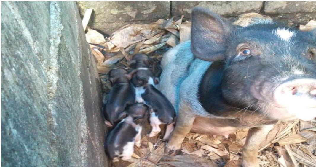
Gambar 1.1. Induk babi dan anak babi lokal

Babi asli Indonesia adalah babi hutan yang sekarang masih berkeliaran di hutan-hutan. Jadi babi-babi Indonesia yang sekarang ini adalah keturunan babi hutan (celeng – sus verrucosus ). Ciri-ciri yang dimiliki babi Indonesia yaitu : berwarna hitam atau belang hitam, atas hitam dan bawah putih, kepala kecil, moncong runcing dengan telinga yang pendek dan berdiri tegak, perut hampir menyusur tanah, karena tulang punggung yang panjang dan lemah serta kaki yang pendek. Beberapa bangsa babi yang telah terkenal misalnya babi Bali, Krawang, Nias dan sumba.