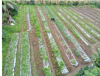
Dok : Desa Martelu