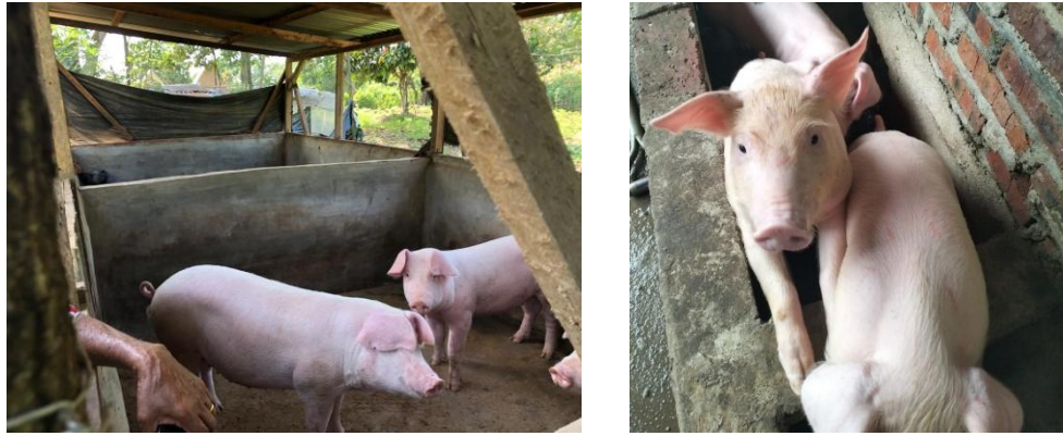
Gambar 1.2. Ternak babi LW