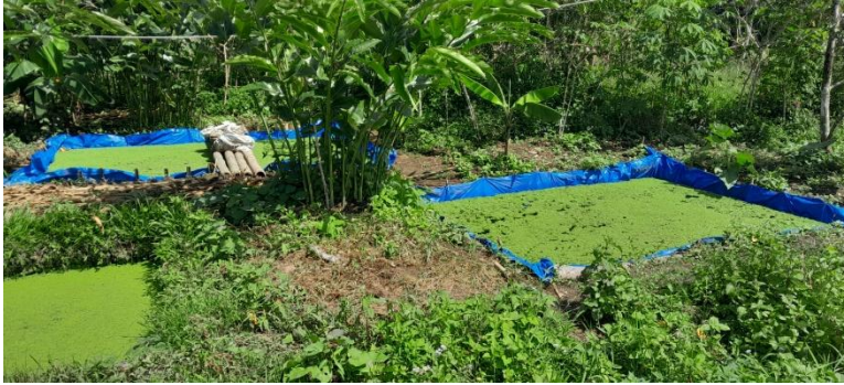
Dok : Desa Derek